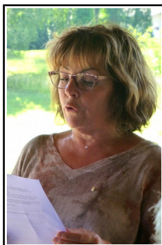
Notre nouvelle présidente